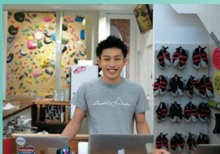
アウトドアフィットネスインストラクター