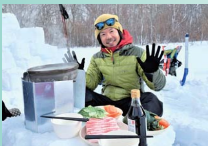
アウトドアガイド

全国に展開している会員制アウトドアフィットネスクラブ、ヨガスタジオ、ボルダリングジムの運営会社に就職。2年目にして新店舗のマネージャーに抜擢。ノルディックウォーキングやボルダリングのインストラクションも担当しています。