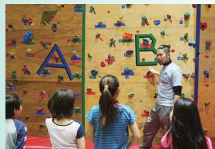
アウトドアスポーツインストラクター

長野県野尻湖畔にある人気のアウトドアツアー会社で、春は山菜採り、夏はカヤック・SUP・ラフティング、秋はキノコ狩り、冬はスノーシュー・歩くスキーのツアーガイドを行う。在学中インターンシップ、アルバイトを経てそのまま就職。